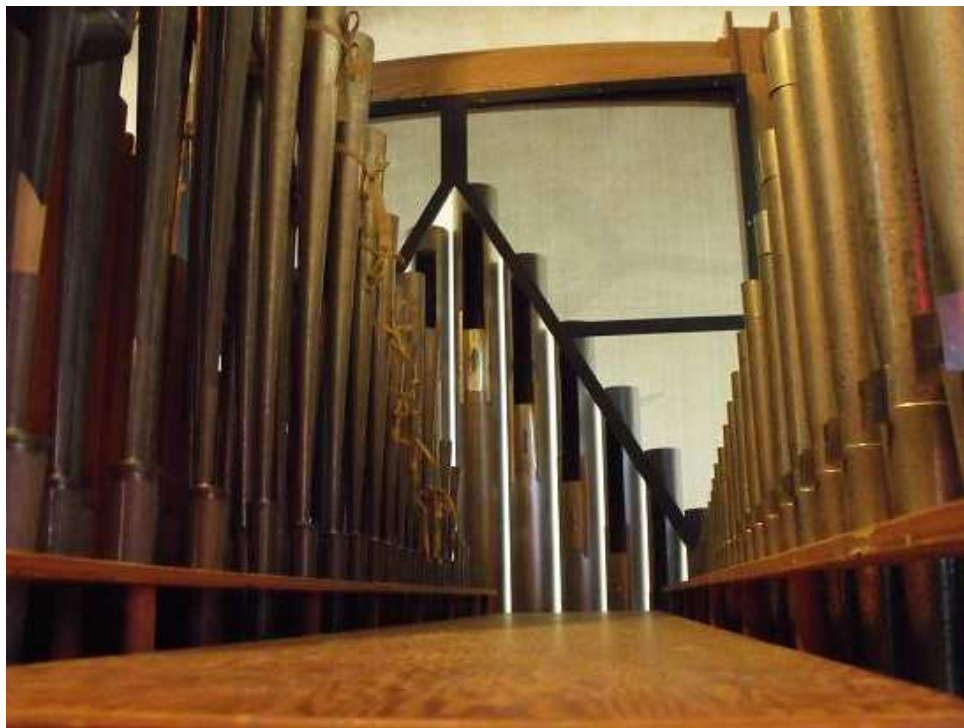
Photo du buffet (vue de face) : Guy Bouchard, CPVN Multimédia Photo du buffet (vue de côté) : Sr Gisèle Larouche, antonienne de Marie Photos de l'intérieur de l'orgue : Christian Villeneuve