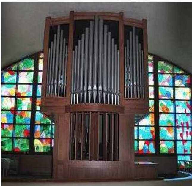
Orgue Providence, Op. 611, 1961 Lévesque Roussin Enr., 2009